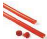
XBA13 listwy ochronne, gumowe, czerwone na ramię XBA, 9x1 m 130,00 159,90 brutto