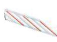
WA13 listwy aluminiowe zabezpieczające w odc. 2 m (do szlabanów M7BAR/LBAR — dobór wg instrukcji) 320,00 393,60 brutto