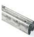
XBA9 łącznik do ramion XBA15/XBA14/XBA5 80,00 98,40 brutto