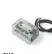
XBA8 moduł semaforów do szlabanów BAR 275,00 338,25 brutto