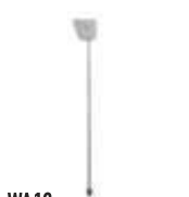
WA12 podpora ramienia ruchoma (do szlabanów M5BAR, M7BAR, LBAR) 250,00 307,50 brutto