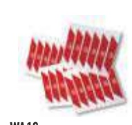
WA10 nalepki ostrzegawcze na ramię szlabanu (24 szt.) 80,00 98,40 brutto