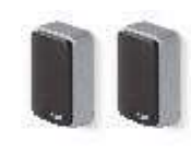
EPMB fotokomórki (para) BLUEBUS zasięg 15-30 m 190,00 233,70 brutto