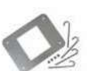
XBA16 płyta montażowa z kotwami 200,00 246,00 brutto