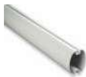
XBA5 ramię aluminiowe, owalne, 69x92x5150 mm 270,00 332,10 brutto