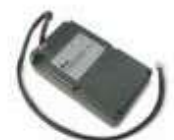
PS224 akumulator 24V 7.2 Ah z wbudowaną kartą ładowania 460,00 565,80 brutto