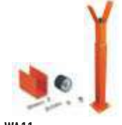
WA11 podpora ramienia stała, regulowana wysokość 250,00 307,50 brutto