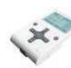
OVIEW/A programator, połączenie za pomocą BUS T4 650,00 799,50 brutto