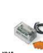
XBA7 moduł lampy sygnalizacyjnej do szlabanów BAR 185,00 227,55 brutto